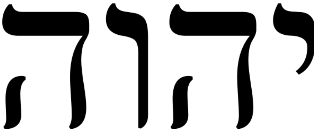
Figuur 1: De Hebreeuwse schrijfwijze voor de naam JHWH

304 maal spreekt de Bijbel over de Schepper als Jehovi , hetgeen een variatie is op JHWH. Deze variant wordt voornamelijk gebezigd door de profeet Ezechiël, te weten 217 maal.